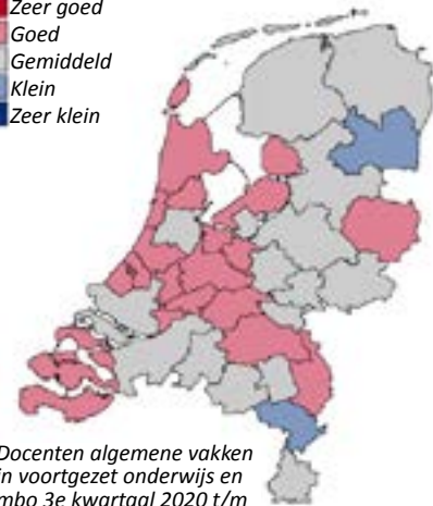
Docenten algemene vakken in voortgezet onderwijs en mbo 3e kwartaal 2020 t/m 2e kwartaal 2021

Zeer goed Goed Gemiddeld Klein Zeer klein